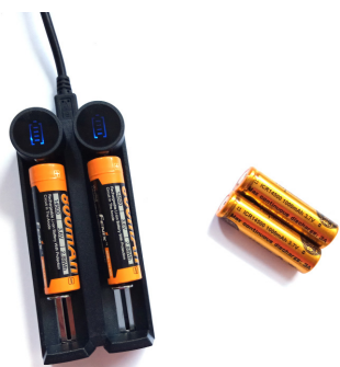
Chargeur et deux jeux de piles inclus