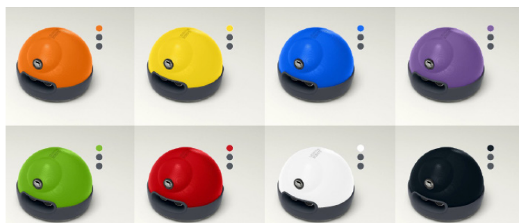
8 coloris disponibles

Le système à enseigner PACK ROBOTIQUE ALPHA I est fourni sous la forme :